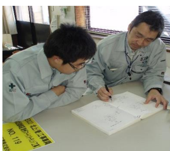
後輩を指導する様子