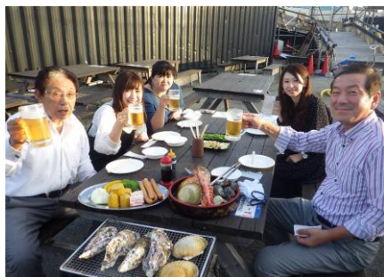
社員旅行の一場面（大阪）