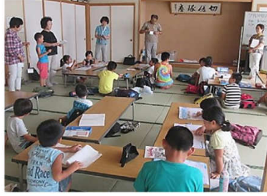
みんなで自己紹介