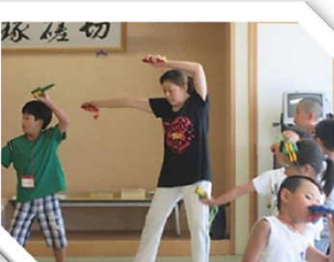
よさこいダンスに挑戦