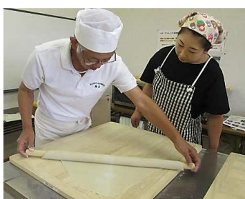
生地を広げる作業