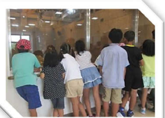
クリーンプラザ見学