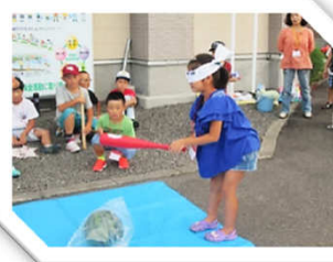
スイカ割り頑張れ!

8月2日(木)、「境町そば打ち研究会」の4人の講師の指導のもとそば打ちを行いました。増田産の新そば粉を使い8人の受講者の皆さんが香り良いそばを完成させました。ご自宅で召し上がった手打ちそばの味は格別だったことと思います。研究会の講師の方々、ご指導ありがとうございました。