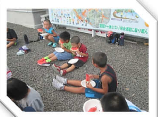
スイカおいしいね