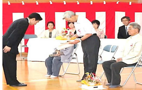
皆さん、楽しそうですね