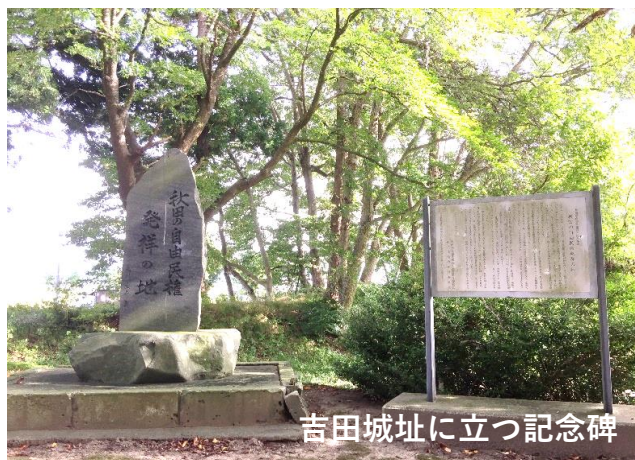
吉田城址に立つ記念碑