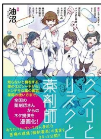
『クスリとリスクと薬剤師』 油沼／漫画 KADOKAWA

全国の薬剤師さんから集まった“薬剤師あるある”を漫画化。身近だけれど実はよく知らない正しい調剤薬局の使い方や、薬の知識を漫画でわかりやすく知ることができます。