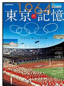
『1964東京の記憶』 JTBパブリッシング

全国の薬剤師さんから集まった“薬剤師あるある”を漫画化。身近だけれど実はよく知らない正しい調剤薬局の使い方や、薬の知識を漫画でわかりやすく知ることができます。