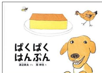
『ぱくぱくはんぶん』 渡辺 鉄太 / ぶん, 南 伸坊 / え 福音館書店

原発事故により今も帰還困難区域となっている福島県双葉町の姿が、震災をきっかけに埼玉に引き取られた犬の目線で描かれています。復興とは何なのかを考えさせられる一冊。