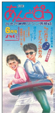
1987年6月号 ハンディサイズ!