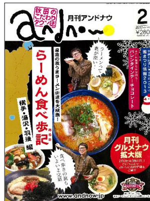
2013年2月号 ラーメン特集は大人気!