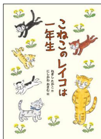
『こねこのレイコは一年生』 ねぎしたかこ / さく のら書店