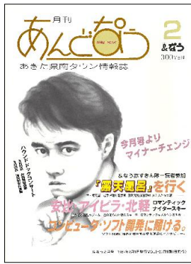
1987年2月号 何度かロゴが変更