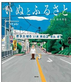
『いぬとふるさと』 鈴木 邦弘 / え・ぶん 旬報社

原発事故により今も帰還困難区域となっている福島県双葉町の姿が、震災をきっかけに埼玉に引き取られた犬の目線で描かれています。復興とは何なのかを考えさせられる一冊。