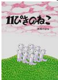
『11ひきのねこ』 馬場のぼる / さく こぐま社