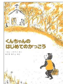
『くんちゃんのはじめてのがっこう』 ドロシー・マリノ / さく ペンギン社

おばあさんが焼いたケーキを、おじさんと動物たちが「半分残しておいてね」と言いながら次々と半分ずつ食べていきます。最初は大きかったケーキ、どうなるのでしょうか？