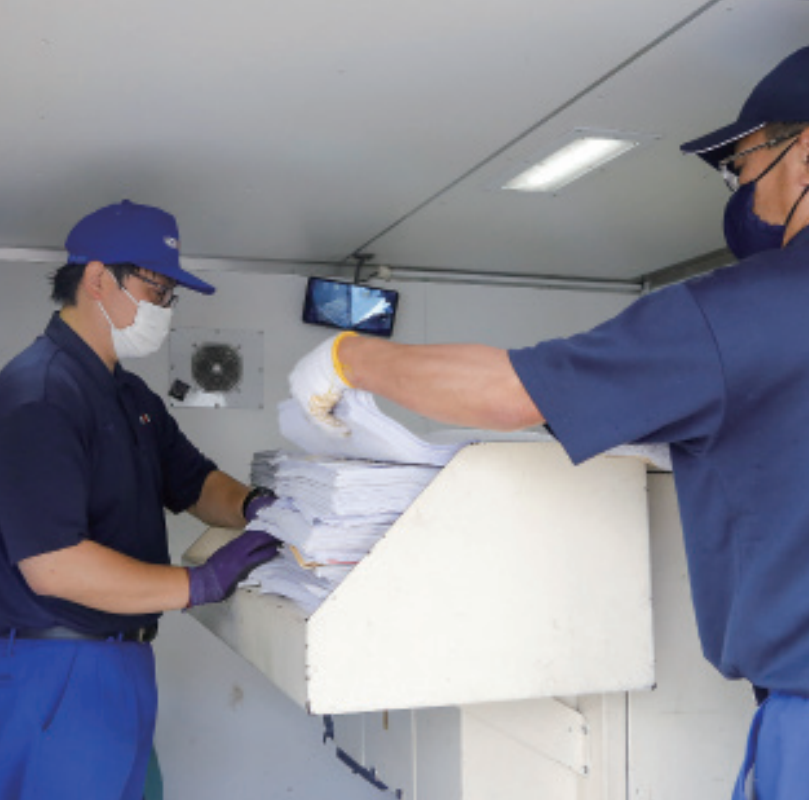
▲環境事業として機密書類の出張断裁サービスやリサイクルも行っています