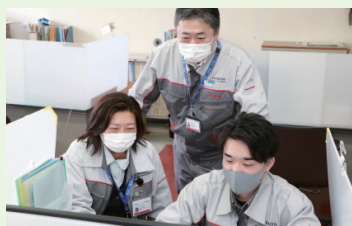
▲職場の先輩に支えられながら、日々、勉強中です

高校でものづくりを学び、将来の仕事にしたいと志したことや、インターンシップや企業説明会でお世話になったこともあり、この会社に入社しました。仕事では総務部門を担当していますが、高校で学んだ技術などは、今の業務にも生かされています。経験や知識を持っていろいろなることに対応できるのです。これから社会に出るまでの学校生活で、幅広く学んでほしいと思います。