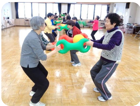
わくわく健康塾 第5回 健康講話と3B体操