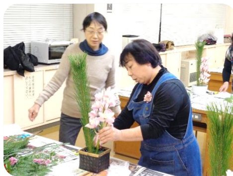
お正月アレンジメント教室