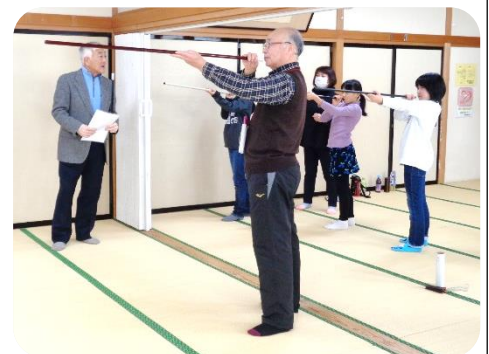
ジュニア・チャレンジ教室 第5回 スポーツ吹矢に挑戦!