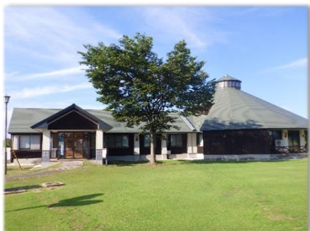
拠点となる施設(大雄交流研修館)

4月からはセンター長と事務員が大雄交流研修館に常駐し住民の皆さんと一緒に地区交流センター事業を行います。