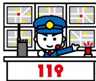
消防急救指揮中心

當消防急救指揮中心接到不會日語的外籍人士打來的 119 通報時，就會立即把電話轉到翻譯專線請求翻譯協助。在電話轉接的過程中會需要一些等待時間，請千萬不要掛斷電話。三方通話接通後，將會有翻譯人員協助通報者使用母語進行溝通。