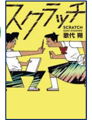
『スクラッチ』 歌代 朔／作 あかね書房