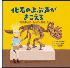
『化石のよぶ声がきこえる』 ヘレイン・バッカー／作 くもん出版