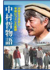
『中村哲物語』 松島 恵利子／著 汐文社