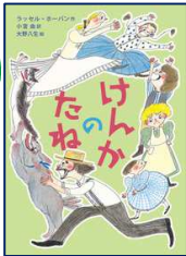
『けんかのたね』 ラッセル・ホーバン／作 岩波書店