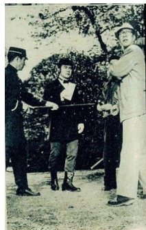
キネマ旬報社『キネマ旬報』第178号(1957)より 右が監督の佐々木康。中央が主演の東千代之介。

雄物川町沼館地区出身の昭和期を代表する映画監督です。中学校時代に映画に興味を持ち、1929年大学在学中に助監督として松竹に入社しました。その2年後に『受難の青春』で監督デビュー、1939年には『純情二重奏』が大ヒットし歌謡映画のヒットメーカーとしての地位を確立します。