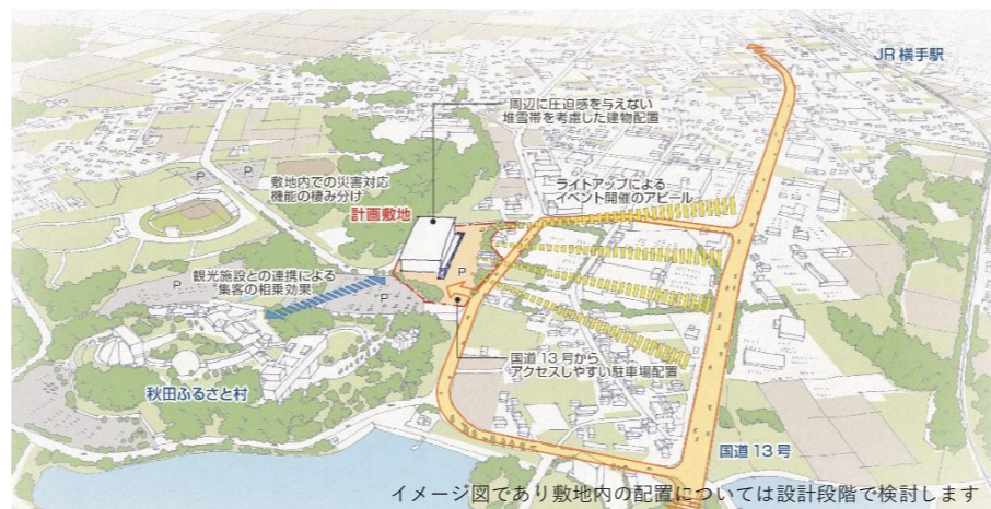
【駐車場】約1,000台（敷地内350台、園内隣接地や既存駐車場合む）