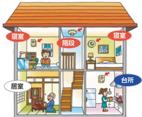
●取り付けが義務付けられている所 ●取り付けをおすすめする所