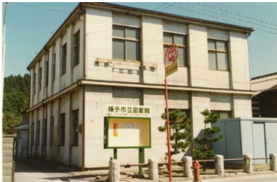
横手市立図書館(昭和40年)

昭和20年の終戦により横手町立横手図書館(旧平鹿郡公会堂)はアメリカ進駐軍の兵舎として使用され、図書館も一時閉館となりました。その後大町や前郷、根岸町など図書館は移転を繰り返し、昭和37年、17年ぶりに創立時の建物に移転しました。しかし翌38年3月、隣接する横手北小火災の影響で蔵書を避難させる過程で、たくさんの貴重な図書が紛失・破損しました。昭和40年、大町にあった羽後銀行(現・北都銀行)本店が秋田市に移転することとなり、本店として使われていた建物を譲り受け、現在地に横手市立図書館が移転しました。 (高本明博)