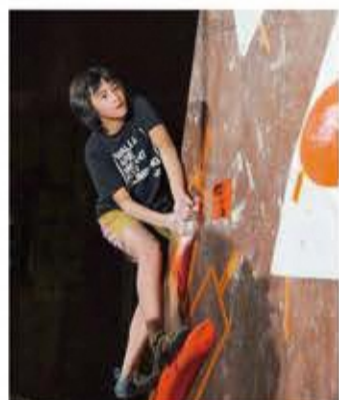
「THE NORTH FACE CUP2019」大会の様子

4月から県外の高校に進学する。スポーツ推薦ではなく、外国語を学びたいとの思いから自らの意思で外国語学科のある高校に進学を決めた。「中2の夏休みにタイへ行った時、海外の文化に触れて新鮮な驚きがありました。大きなクライミングジムもあり、日本だけじゃなく世界のコースにも挑戦してみたいと思ったんです」と話す。いずれは世界を転戦する競技者になるのか、世界を股にかけて飛び回る仕事につくのか、夢と希望を胸に、これからも彼女は壁を登り続ける。