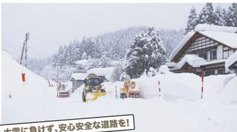
大雪に負けず、安心安全な道路を！