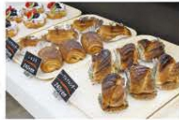
焼きたてパン屋 Jiji 横手市寿町8-27 TEL.0182-36-7118

Ji Jiでは『ルヴァン種』『サワー種』を自家培養して使用しています。扱いが難しいため、導入しているお店は少数であるとのこと。酵母にこだわることで、香りや歯ごたえに優れたパン作りを行っています。一度食べたら違いがわかる」と語る通り、パン好きを唖らせる本物の味にこだわっています。