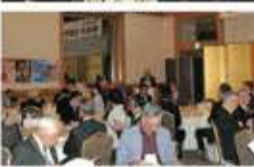
↑前回開催した総会の様子。

この一年、コロナにより失った ものも多かったですが、お互いに 助け合う思いやりの大切さを改 めて見直す機会となりました。秋 田人のおおらかで豊かな心で必 ず笑える日がやってくることを 信じて歩き続けましょう。本年11 月開催予定の総会を期待する皆様 同様に、私達役員も今年こそその 思いも強く「第46回総会・懇親会」の 開催を願っています。