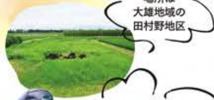
場所は 大雄地域の 田村野地区

実際に大雄地域の上を掘り起こして泥炭を作り、燃えるのか実験! 点火する瞬間はドキドキした〜。