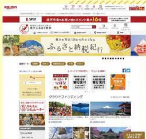
《楽天ふるさと納税のトップページ》

横手市では、全国の皆様からふるさと納税で応援していただくことにより、横手ファンの拡大・地域課題の解決・地域産業の活性化などに取り組み、より魅力的で市内外の皆様から愛される横手市を目指して励んでおります。令和元年10月からは、さらに横手市の魅力を全国に向けてPRし、ふるさと納税を通じて横手とのつながりを築いていただくため、『楽天ふるさと納税』での寄附受付を開始し、ふるさと納税の申し込みの利便性を高めました。