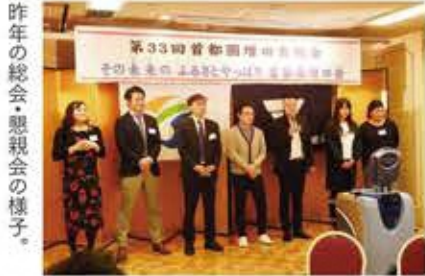
昨年の総会・懇親会の様子。

「いものこ汁」で仲間とふるさとこの酒を! 毎年11月の第3日曜日に総会と懇親会を開催しています。首都圏にお住まいの増田出身者はもちろん、最近では新たに増田のファンになった関係者もご参加いただいています。若手の役員も増え、役員が一気に若返りました。