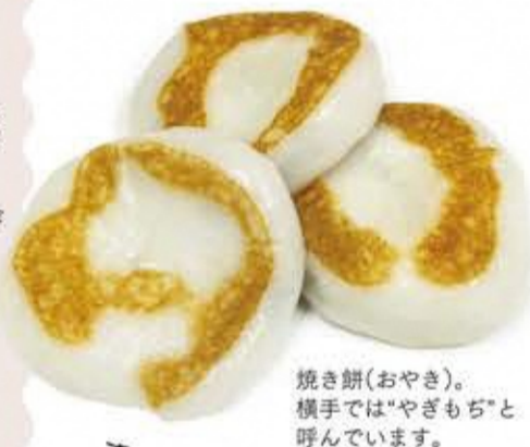
焼き餅(おやき)。横手では「やぎもち」と呼んでいます。

もち米粉の分量に対して別粉を1~2割程度にせば、昔ながらの焼き餅に仕上がると。餅の伸びは良くないし日持ちもしねけど、「昔の餅らしい餅」が好き方にはオススメだ。 私だば、小麦粉のかわりに蒸しパンミックスやパンケーキミックスどご入れるな。甘みも入ってるから、ちょうどいいんだ。