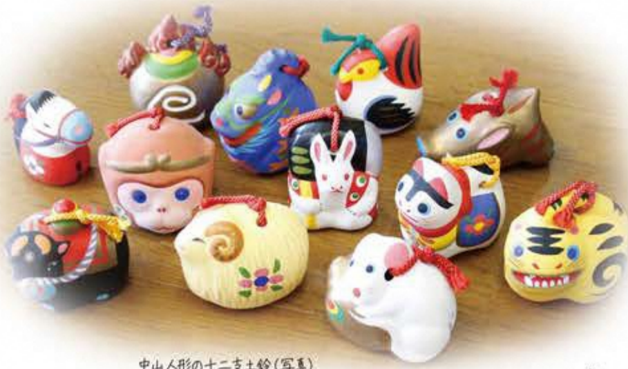
中山人形の十二支土鈴(写真)