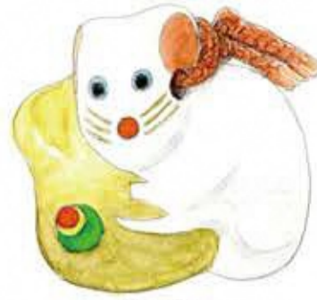
来年の干支、 ねずみの土鈴。

左きでぎんねに拍子掛は、 人を拍子でくれる。 運が上向くようにと 上目使いで笑みのある表情。