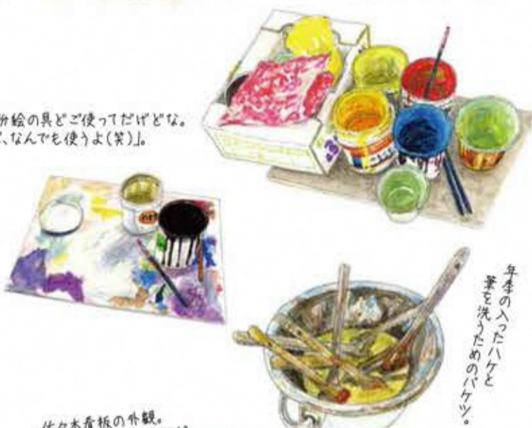
毎季の入ったハケと 筆を洗ったためのバケツ。