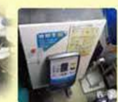
カメラの色彩選別機

横手産米の品質向上とさらなるブランド化の推進を図るため、米の色彩選別機を導入する農家に支援を行いました。カメラが食べ残した黒い米などを検出することが可能となり、見た目も向上します。