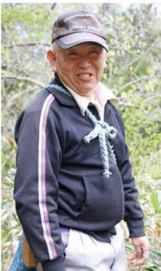
カメラを向けると、「この先にいっぱいあるんだ。おめ、付いてくれるが？」と満面の笑みを浮かべた。

群生するコゴミを愛用のナタで素早く刈っていく。アクが少なくクセの無さが人気の山菜。天ぷら、おひたし、コゴミ和えとさまざまな料理で食べられる。