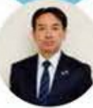
横手市長 高橋 大

平成30年度のふるさと納税寄附金は前年度から2億5000万円増え、総額7億5000万円を超える受領額となり、2年連続で大幅な伸びとなりました。