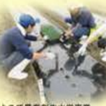
よこて農業創生大学事業

「よこて農業創生大学事業」では、野菜や花卉などの園芸作目の実践的セミナーや新規就農者向けの研修などを行い、横手の農業を魅力ある産業とする取り組みを進めました。