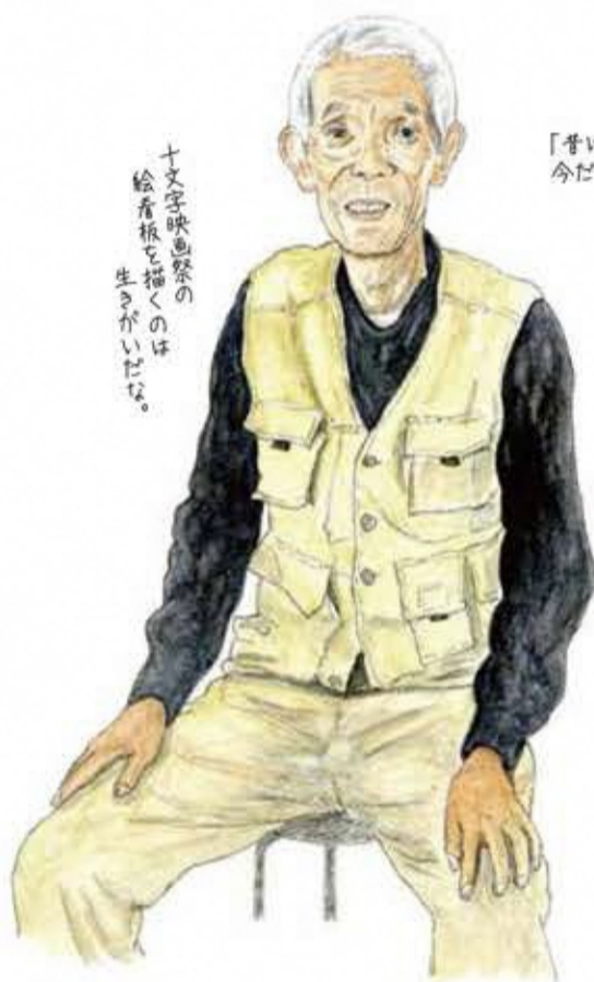
十文字映画祭の 絵看板を描くのは 生がいだな。