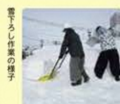
雪下ろし作業の様子

「放課後児童健全育成支援事業」として、横手市でも年々利用者が増加してきている児童保育施設の運営を充実させていただきました。子どもたちは元気に放課後を過ごしています。