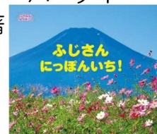
ひさかたチャイルド