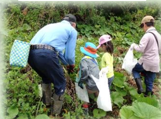
ほら、ここにあるよ！