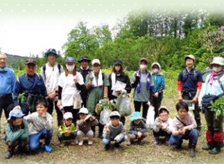
たくさん採れて笑顔でパチリ