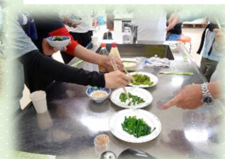
採れたてをいただきます