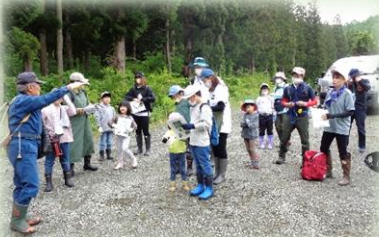
ガイドさんの説明を聞いて…