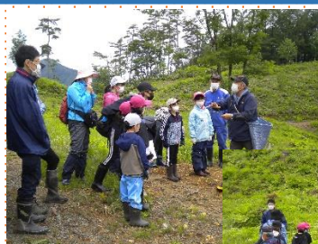
ガイドさんの説明

地区交流センター最初の事業だったチャレンジキッズ「山の恵みを探しに行こう」を6月5日（日）に実施しました。参加者は4家族12名でした。「初めてわらび採りをしていっぱいとれてよかった」「試食したわらびがおいしかった」「もっと山内たんけんしてみたい」などの声が聞かれました。次回はキノコ採りを予定しています。