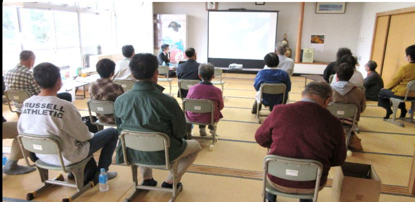
★市の長瀬危機管理課長による防災講話の様子