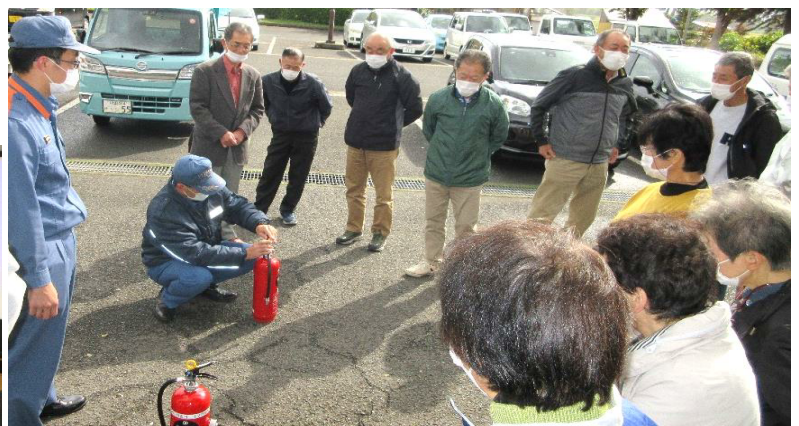
★消防署南分署の火災予防講話と消火器の使用体験の様子