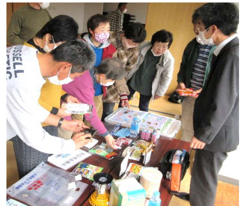
★様々な防災用品を確認