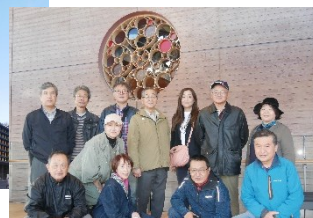
あきた芸術劇場ミルハス