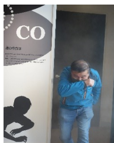
煙の中を歩く体験