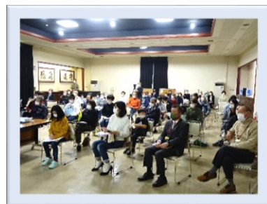
子ども達も多く参加してくれました。