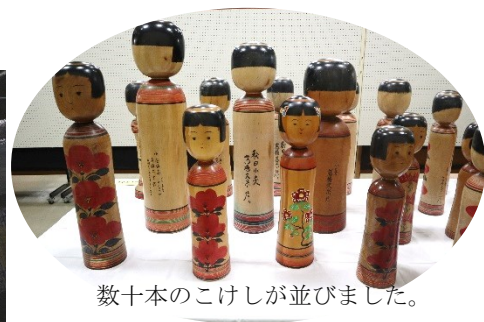
数十本のこけしが並びました。