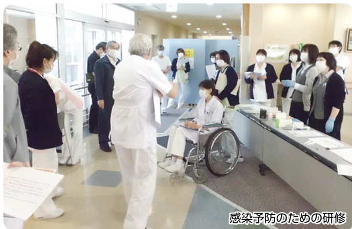
感染予防のための研修