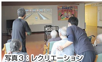
写真3: レクリエーション