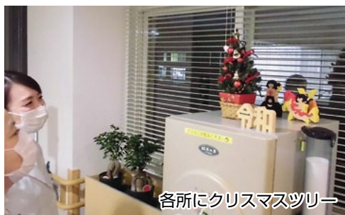
各所にクリスマスツリー