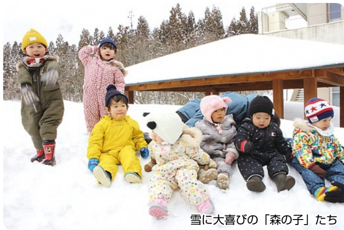
雪に大喜びの「森の子」たち

これからも、地域住民の健康の拠点となり、地域の安心感の拠り所としての病院運営を続けていきます。