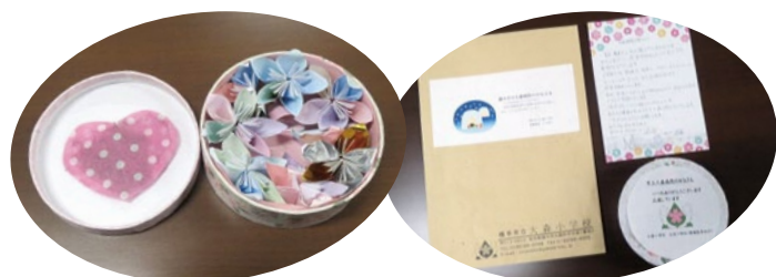
大森小学校からの励ましのお手紙とプレゼント