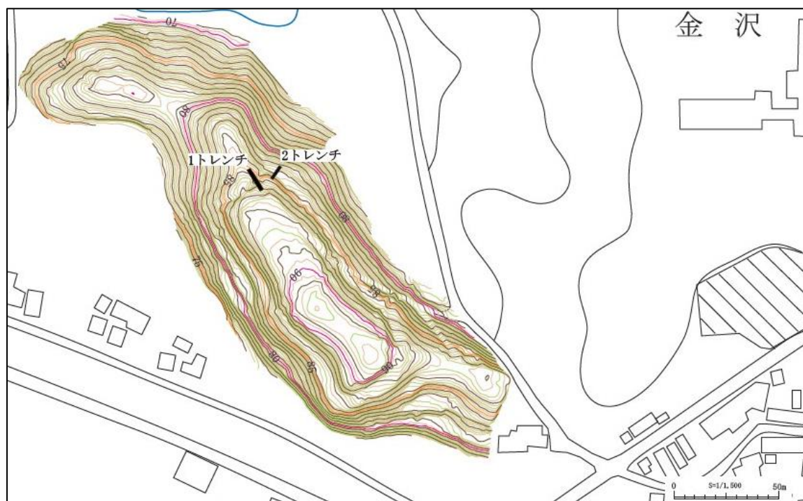
第1図 長岡森館地形測量図とトレンチ位置図（東→）

長岡森館では今年度の調査で遺物が出土しなかったことから、来年度以降は時期の特定を目的に、平坦部の調査を実施したいと考えております。