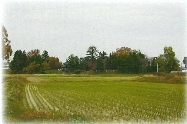
【沼館城跡近景】 沼館城跡を南から望む