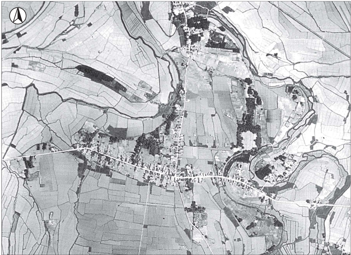
【造山地区周辺の航空写真 1948年】