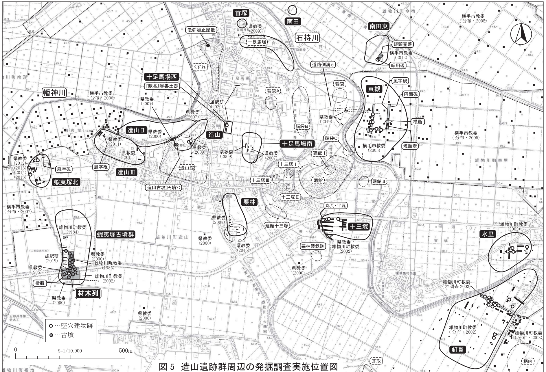
図5 造山遺跡群周辺の発掘調査実施位置図