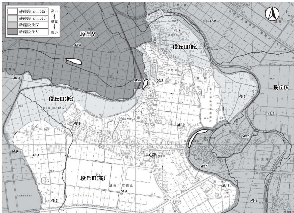
【造山地区周辺現況地形図】 ※横手都市計画基本図(平成18年測量)に