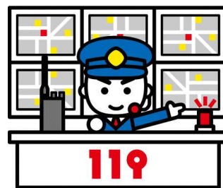
消防急救指揮中心

當消防急救指揮中心接到不會日語的外籍人士打來的 119 通報時，就會立即把電話轉到翻譯專線請求翻譯協助。在電話轉接的過程中會需要一些等待時間，請千萬不要掛斷電話。三方通話接通後，將會有翻譯人員協助通報者使用母語進行溝通。