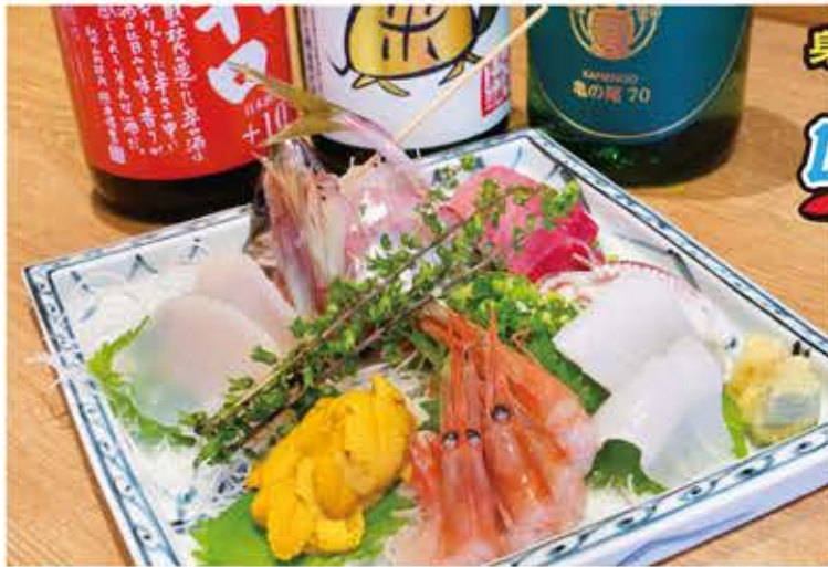
↑食材は古関さん自ら市場で吟味して仕入れており鮮度バツグン! 地元・十文字地域から横手の旬の食材を送ってもらうことも。山内産のいぶりがっこも好評です。