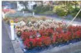
↑花植えをした花壇。道路に面しており、通行人が見ることができる場所の花植えに関して助成しました。