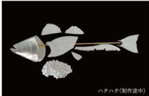
ハタハタ(制作途中)

展示と同時に銀線細工の体験会も開催した。「職人自身にスポットを当てることで、「あんな職人になりたい」という憧れられる職人像をつくりたい。伝統工芸も受け継ぐ人がいなければ、その技術は絶えてしまいます。子どもたちの将来にたい職業の一つとして職人が選択肢にあがる必要があるんです。いい作品をつくっても、稼げない、売れないではだめなんです。職人たちには作品作りに集中してもらい、私たちは職人の