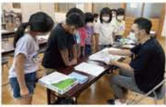
↑プロの漫画家が指導する「マンガ教室」。

マンガを活用した教育事業の一環として、市内の小中学生を対象にマンガ作品を募集し、応募された作品で1冊のマガジンを制作しました。本事業は4年目となり、今回は「よこて」をテーマに作品を募集。応募のあった103作品すべてに、プロの編集者からいただいたコメントをつけてマガジンを制作し、市内公共施設や図書館など約100ヶ所に配布しました。市ホームページでも作品を公開しております。