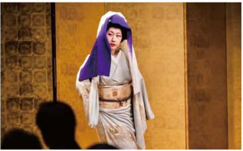
芸者になると着物や髪型が変わり、お座敷では踊りのほかに三味線や唄を披露する。芸に磨きをかけるのはもちろん、根底にあるのはおもてなしの心だ。

あきた舞妓を始めるまでの10ヶ月間、見習いとして日本舞踊の修行をした。稽古は週に1〜2回。それ以外の時間は、秋田