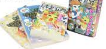
↑完成したマガジン「ミラマガ☆」。一番右が今年度発行のもの。