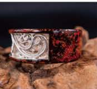
五衣-itsuginu- 銀線×漆リング 銀線細工の緻密な縫り目の唐草模様と秋田川漆塗りの蒔絵技法を用いた漆塗装。鮮やかな漆の光沢が全体の印象を華やかにしている。