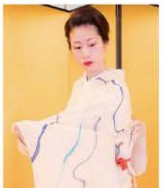
白塗りをせずに、お座敷に上がることもあるという。

ほしい」などリクエストをいただくのと、稽古のモチベーションも上がります。私はもっと身近な存在として、秋田に花柳界を定着していければと思っています」 川反芸者は、大正時代から昭和初期に隆盛を極め、生み出す街の賑わいは東北一と称されたほど。「その名に恥じぬよう芸を磨き精進してまいります。そして、あきた舞妓を引っ張っていきけるように常に勉強してまいります」