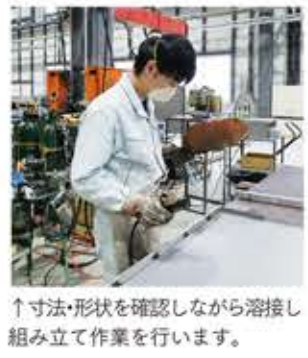
↑寸法・形状を確認しながら溶接し組み立て作業を行います。