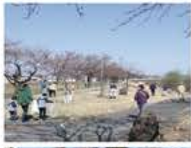
↑クリーンアップの様子。

令和4年4月17日(日)に約12000人が参加し、初めての全市一斉クリーンアップ「横手愛クリーンアップDAY」を実施することができました。また、花植え活動に関する助成なども行い、市民協働での環境美化活動を進めることができました。