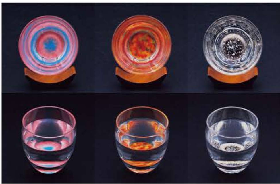
この春誕生した蒔絵模様の日本酒グラスは、自然豊かな秋田の四季を蒔絵で表現。日本酒を注ぐことで、鮮やかな図柄が奥行きを持って浮かび上がる。写真左より、桜、紅葉、しんしん。ほか、夜桜、向日葵、夜祭、臘月、輝雪がある。