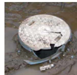
【接続ます破損写真】（イメージ）

家庭や工場などから発生する汚水を公共下水道（下水道管）に流すために設けられた汚水管、接続ます、その他の排水施設をまとめて「排水設備」といいます。