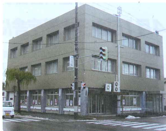
4月から開設する「水道お客様センター」

横手市水道お客様センターは、四日町の水道庁舎1階(旧横手市社会福祉協議会横手福祉センター)で各種申請書の受付や料金徴収業務を行います。