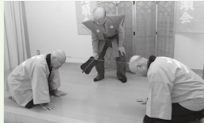
体勢を低く、角度をつけること。が勝負の決め手