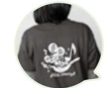
お揃いのTシャツで演奏しました♪

1月30日、秋田大学の音楽サークルによるコンサートが雄物川コミュニティセンターで行われ、ジャンルの異なる4つのサークルが参加。「音楽の楽しさを伝え、音楽を楽しむ心で秋田・横手を元気にしたい」と学生が企画し、秋田大学横手分校事業として実施したものです。学生たちのパワフルな演奏に、会場に訪れた約220人の観客は、手拍子や拍手で応えていました。