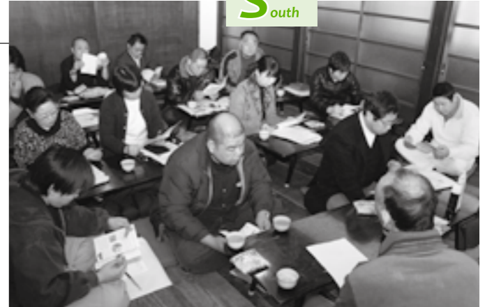
横手やきそばのソースについての講義に真剣な眼差しで取り組む参加者

この道場の第2回は2月21日・22日、第3回は3月21日・22日に開かれ、その後はおおむね半年に1回のペースで開催される予定です。