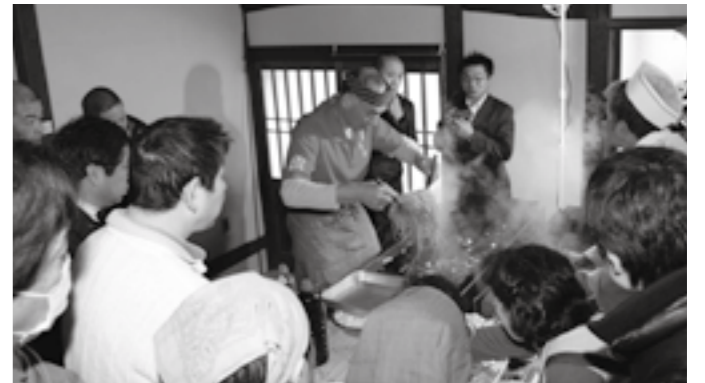
暖簾会会員による実技指導。写真や動画を撮影する姿も見られました。