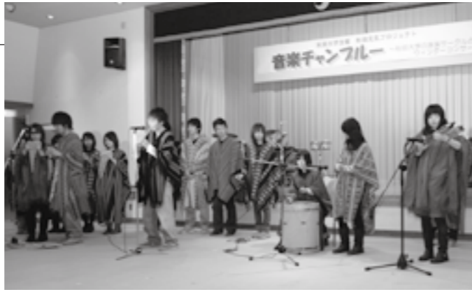
会場が一体となった、南米民族音楽サークル[La-mia(ラ・ミア)]