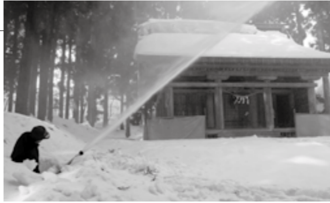
南北2か所に設置されている放水銃による放水訓練

○文化財防火デー…世界最古の木造建築物「法隆寺金堂壁画」が焼失した日(1949年1月26日)にちなみ、火災・地震などの災害から文化財を守るために制定された。