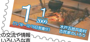
読者同士の交流や情報交換に、いろいろな声をお寄せください。