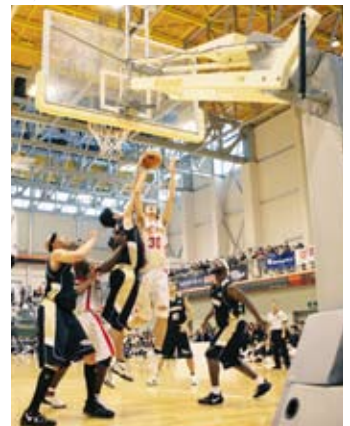
昨年の増田大会(アイシンvsオーエスジー)

国内トップレベルのバスケットボール選手が競い合うJBL(日本バスケットボールリーグ)の公式戦が、今シーズンも増田体育館で行われます。 国内最高水準のスピードと迫力満点のプレーが、生で観戦できるまたとないチャンス。バスケットボールファンだけでなく、スポーツの好きな方なら必見の一戦です。