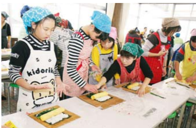
巻きすを使った巻き方のコツを教わる子供たち