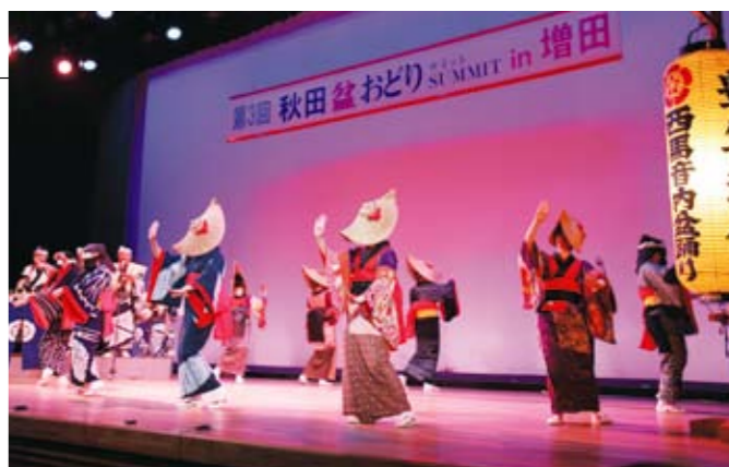
色鮮やかな衣装で優雅な舞を披露した西馬内盆おどり

12月14日、増田ふれあいプラザで『秋田盆おどりサミットin増田』が開催されました。これは、盆踊りの保存継承と後継者育成を目的としたもので、ステージでは、増田盆おどりや田中盆おどり、西馬音内盆おどりが披露された後、県内の盆おどり保存会代表者らによるパネルディスカッションなどが行われました。また、最後に増田小学校児童らが、増田盆おどり発祥にまつわる悲話をもとにしたミュージカルを演じ、その名演技に観客から惜しみない拍手が送られていました。