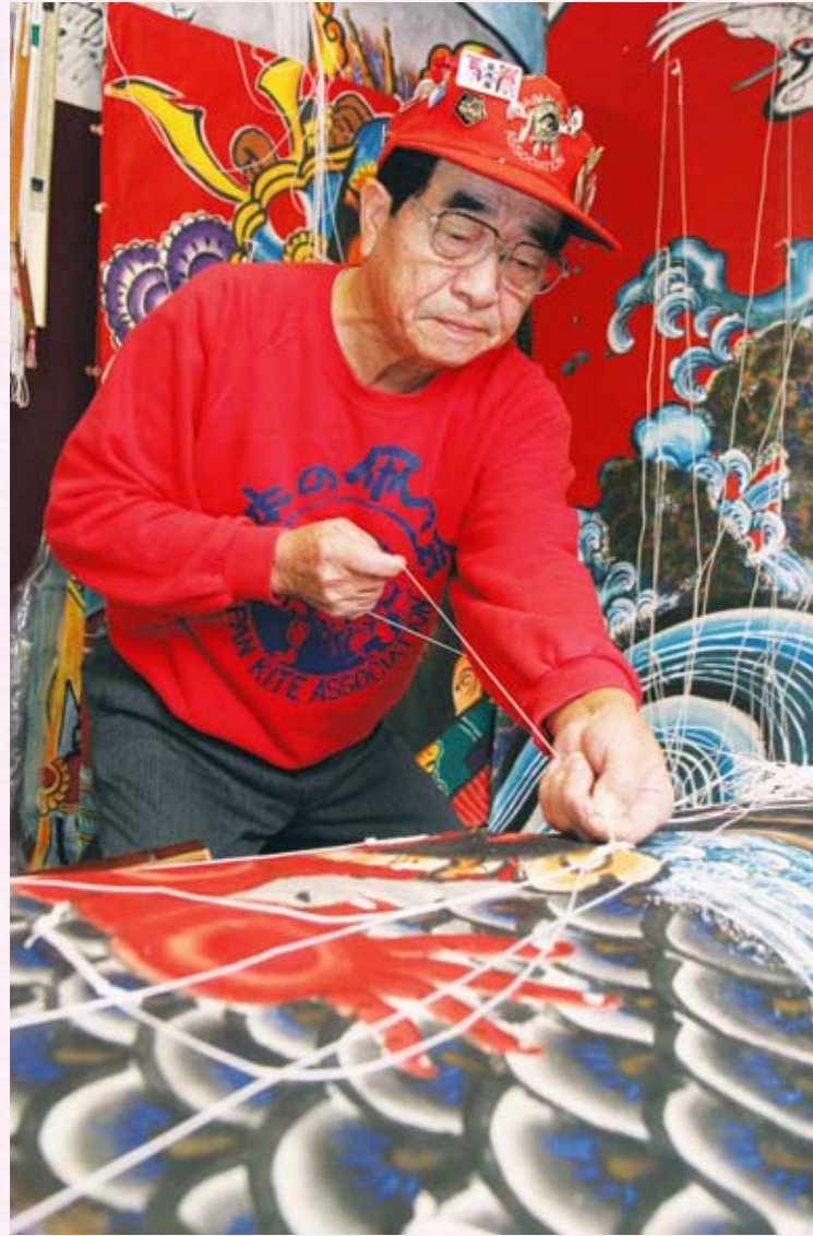
横手凧復活を夢見て... 少年時代の熱き思いを今に