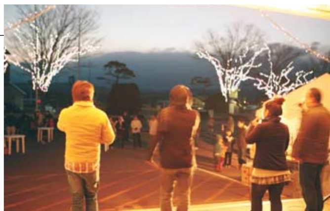
ロマンティックなアカペラの歌声がさらに幻想的な雰囲気を演出

12月14日、市役所大森庁舎前のケヤキの木が電飾で彩られる『けやき並木のイルミネーション』の点灯式が行われ、地域住民など150人以上が見守る中、9本のケヤキに幻想的な灯りがともされました。 会場では、手打ちそばや温かい豚汁などが振る舞われたほか、『コーラス路』とアカペラグループ『ウスペラズ』によるミニコンサートも開かれ、来場者を楽しませました。芝桜をイメージした華やかでやさしいイルミネーションは、1月12日まで点灯されます。