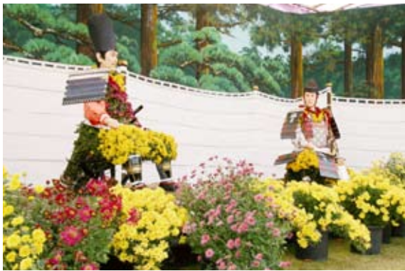
菊人形展『義家と義光』

会場には、市内外の愛好家が丹精こめて育てた白や黄、紫など色とりどりの約三千二百鉢が並び、見事に仕立てられた大輪や三本立て、千輪咲などに足を止めて見入る人々の姿が見られました。恒例の菊人形展は、横手が舞台となった後三年の役をテーマに、源義家が金沢柵へ行軍中、普段は整然と列をなして飛ぶ雁が