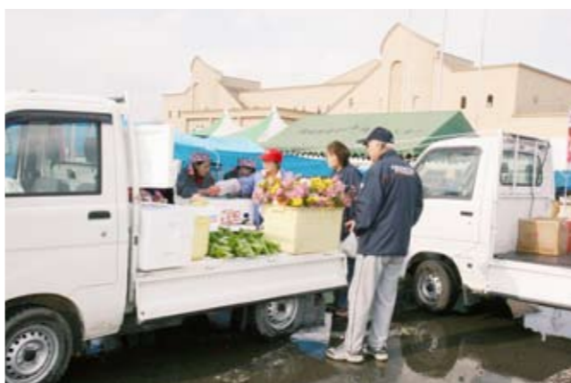
自慢の品が荷台にずらりと並んだ「軽トラ市」