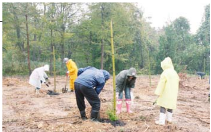
悪天候の中での植付け作業

■全国植樹祭記念植樹(増田) 11月3日、全国植樹祭記念植樹が増田町吉野字大沢地内で行われました。これは、今年6月に北秋田市で行われた全国植樹祭を記念し、増田地域局が秋田県水と緑の森づくり税を活用して行ったものです。 この日はあいにくの雨模様の中、市民約60人が参加。ぬかるみに足を取られながら、ブナやヤマモミジなど全国植樹祭と同じ6種類の樹木165本の苗木を植え付けました。参加者たちは森林環境の整備を通して地球環境保全の重要性を再認識したようでした。