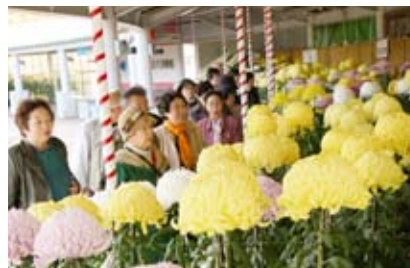
見事な大輪に見入る来場者

乱れているのを見て、敵軍がいるのを察知し、せん滅したという『雁行の乱れ』と、義家の苦境を知った弟の家光が京の官を辞して来援したという『義家と義光』の二場面が再現され、色鮮やかな衣裳を身にまとった武者姿が来場者の目を楽しませていました。