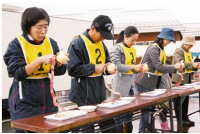
1分間でどれだけ長くむけるかを競った、りんご皮むき競争