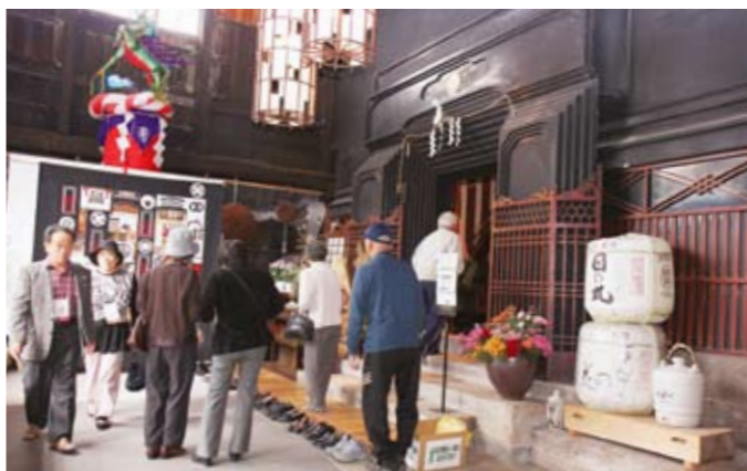
各内蔵には多くの見学者が訪れました