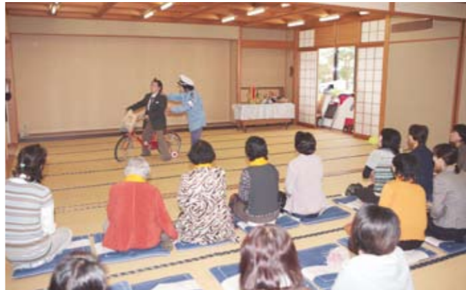
コミカルな演技で道交法の改正点などをわかりやすく伝えました

10月6日、雄物川コミュニティセンターで市交通安全母の会連絡協議会の研修会が開催され、交通安全協会増田支部女性部のみなさんが寸劇を披露しました。「お酒2合100万円」と題された劇は、高齢運転者標識(通称もみじマーク)の表示と自転車同乗幼児のヘルメット着用が義務化されたことや、飲酒運転の罰則強化などを盛り込んだ筋書き。コミカルな演技で笑いを誘いながらも、道路交通法の改正内容をわかりやすく伝え、交通安全意識の高揚を呼びかけました。