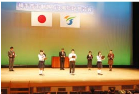
『子どもの権利宣言』は宣言づくりに携わった次世代育成委員と『YOKOTEっ子宣言』が採用された横手南中の生徒代表が宣言文を読み上げました

第二部では、吉田小スクールバンドが息のあったマーチングを披露した後、『男女共同参画都市』、『非核平和都市』、『子どもの権利』の3つを宣言。市がめざすまちづくりの姿勢を