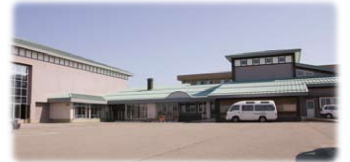
境町公民館(ふるさと館)

境町地区では、第一投票所(境町公民館)と第二投票所(相愛保育園)の2か所で投票が行われていましたが、今年度からは境町公民館のみとなります。境町地区の方はお間違えのないよう、お願いします。