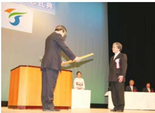
市の表彰条例に基づく表彰者第1号として五十嵐市長から表彰状を受け取る漫画家の矢口高雄氏

続いて、市の功労者として増田町出身の漫画家・矢口高雄氏を表彰。市表彰条例に基づく初の受賞者となった矢口氏は「社会に出て50年の節