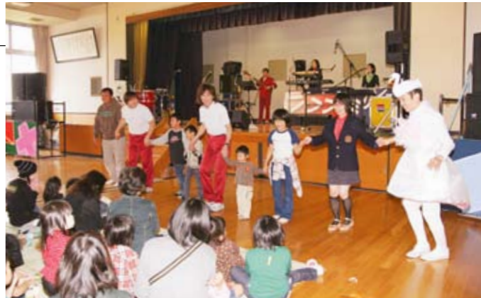
観客も参加してのパフォーマンス

10月5日、大森コミュニティセンターで北海道札幌市を拠点に活動する「パフ・ファミリー」による『イキイキわくわく音楽会』が開催されました。これは青少年育成市民会議が主催し、次世代を担う子供たちに音楽の楽しさを伝え、心豊かに健やかに育つことを目的として行われたもの。会場では、アニメや映画音楽の演奏のほか、歌やマジックショーが披露されたほか、観客も一緒になって踊る一幕もあり、訪れた親子連れは全身で音楽を楽しんでいました。