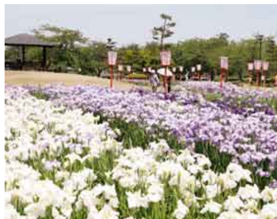
あやめは、まつり期間中にちょうど見ごろを迎えました