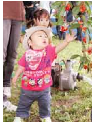
初めてのサクランボ狩りを体験

例年に比べ、サクランボの糖度が高く、生育状況が良かったという今年。サクランボがたわわに実った樹園地には、県内外から親子連れや老人会、保育園児たちが訪れ、サクランボ狩りを楽しむ姿が多く見られました。