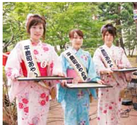
みこと栄冠を手にした3人のあやめ娘

平鹿の初夏の風物詩「あやめまつり」が、6月28日から7月6日までの9日間にわたり、浅舞公園を会場に開催されました。期間中は、80種3万株、50万本の色とりどりのあやめが訪れた人々を魅了しました。 週末には数々のイベントが行われ、特に恒例となったミスあやめコンテストには市内外から11人が出場。美人に形容されるあやめにふさわしい3人のあやめ娘が選ばれました。 また、熱気球係留、超神ネイガールショー、長まんじゅうまきなども行われ、たくさんの方の親子連れなどでにぎわいました。