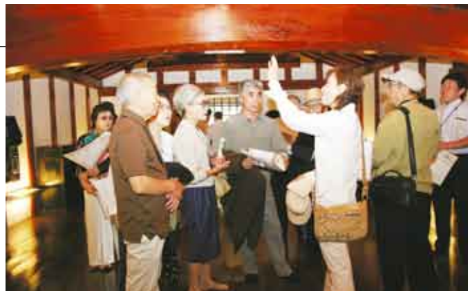
増田の内蔵について「蔵の会」の観光ガイドから説明を受ける参加者

これは、合併後の市内各地を巡り“新たな故郷”を発見してもらおうと同会が企画し、市のサポートで行われたものです。参加者は「広くなった故郷の歴史や文化を学ぶことができた。懐かしい方言を耳にし、会員同士の交流が深まったと思う。今後は故郷の活性化のために協力していきたい」と話していました。