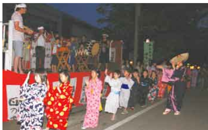
お囃子の曲に乗せて増田盆おどりを奉納

当日の天候は薄曇りの好条件。選手の力走に沿道から終始声援が送られ、タスキをつないだ選手たちからは疲労感とともに爽やかな達成感が感じられました。