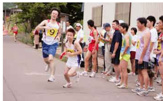
お隣の思いをつなぐタスキリレー(狼沢公民館前の第5中継所)