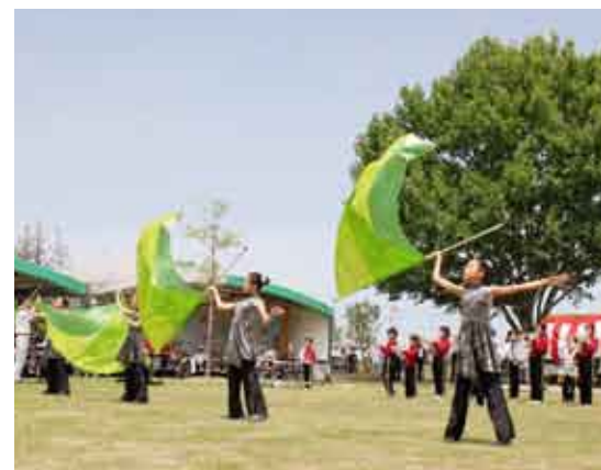
オープニングを飾る、吉田小スクールバンドドリル演奏