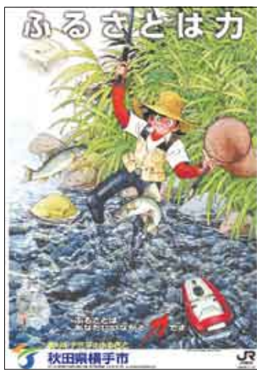
受賞した市の観光ポスター「春」バージョン(左)と「夏」バージョン(右)

このポスターは八千枚印刷され、県内外のJR駅や市内の観光施設に掲示していますので、お立ち寄りの際は、ぜひご覧ください。