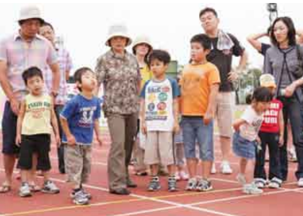
サクランボの種を飛ばして新記録に挑戦する子どもたち

また、沿道に並んだ直売所や道の駅十文字では、サクランボを求めて訪れた観光客たちが列をなし、大いににぎわっていました。