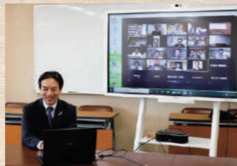
市民にも行政にも役立つデジタル化について、理解を深めました

この夏は『新しい生活様式』で迎える初めての夏です。これまで以上に体調管理に努めていただき、熱中症などにお気をつけください。