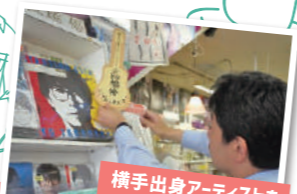
横手出身アーティストを 応援する店員の1枚

応募方法 ● フォトコンテストWeb専用ページから応募 ● プリントした写真(2L版)に加え応募用紙を封筒に入れ、横手の魅力営業課へ郵送、または、横手の魅力営業課、横手市役所本庁舎、各地域局窓口へ持ち込み ※応募用紙は、フォトコンテストWeb専用ページからダウンロードするか、上記応募先へ備え付けの用紙をお使いください。