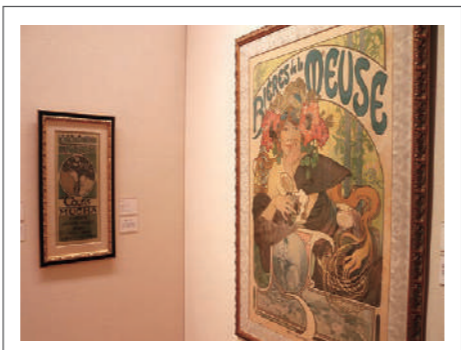
県立近代美術館では『ミュシャ展』を9月13日(日)まで開催中。代表作『ジスモンダ』をはじめ、約450点を展示しています。ぜひご覧ください!