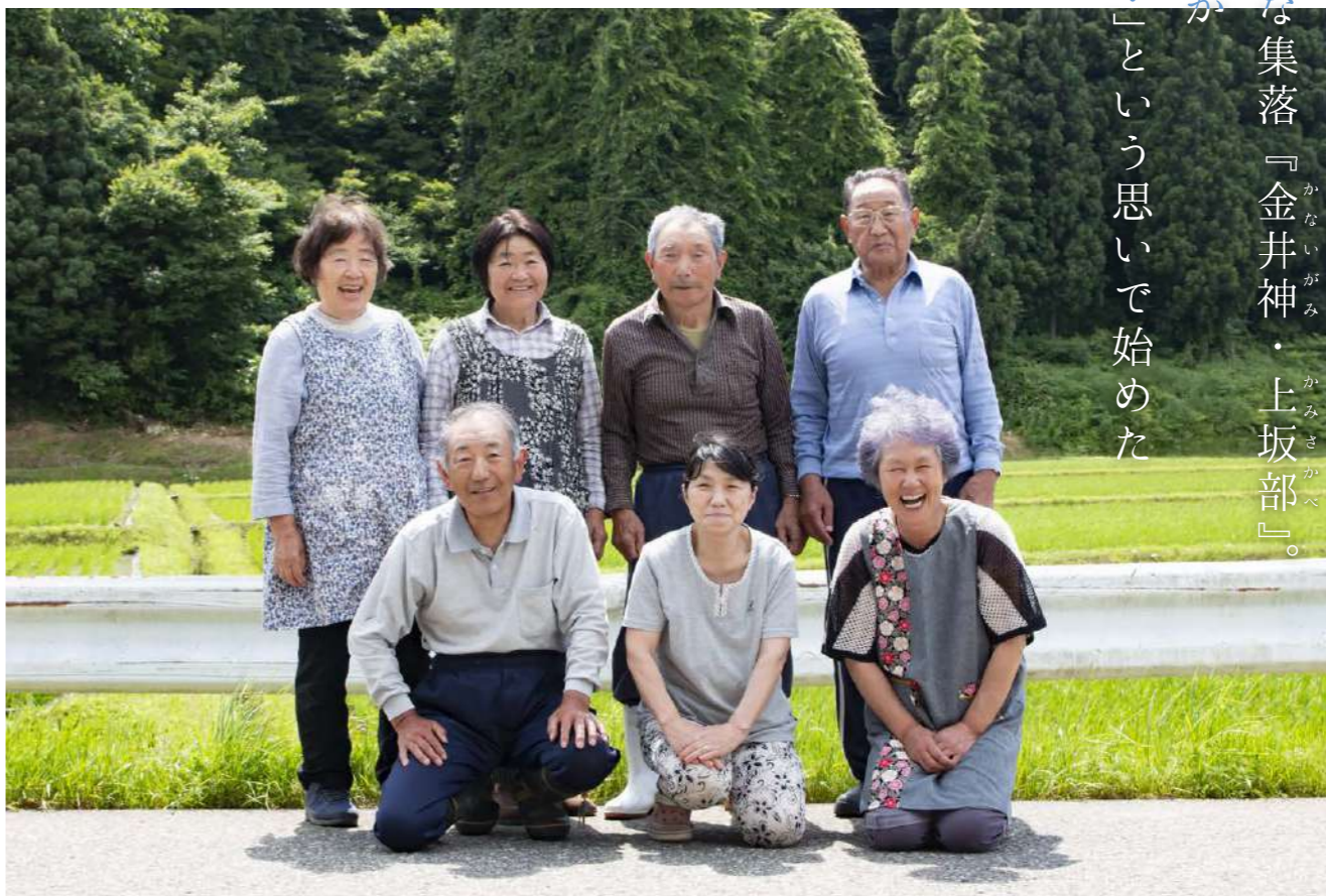
金井神・上坂部集落の皆さん