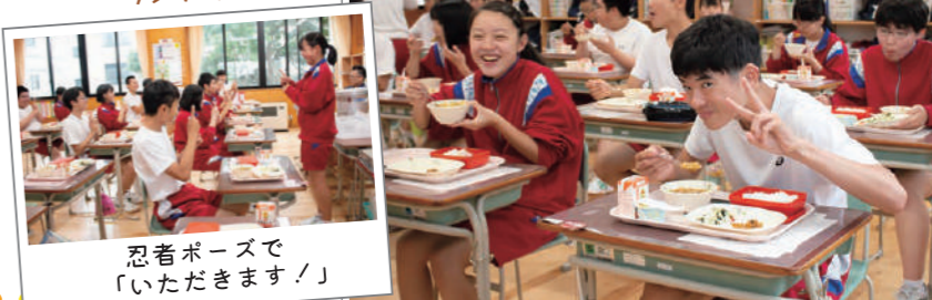
忍者ポーズで「いただきます!」