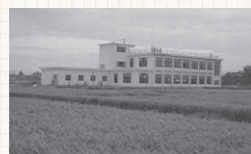
田んぼの中にたたずむ、昭和35年竣工時の第一庁舎裏側

現在、老朽化に伴う庁舎の建て替え工事が進められており、令和2年10月には、町の発展を見守り続けた庁舎が役目を譲ります。新しい庁舎は、バリアフリーや再生可能エネルギーの地中熱を活用した空調設備が備えられ、耐震性も十分に確保されることから、地域防災や情報の拠点として期待されています。