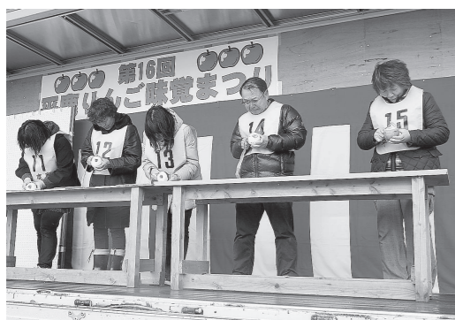
昨年のりんご皮むき競争の様子