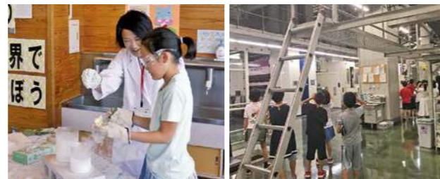
▲科学お楽しみ広場「-196℃の世界で遊ぼう」のコーナー ▲小学生職場見学ツアー

夏休みに小学生対象の『科学お楽しみ広場』や『小学生職場見学ツアー』、受入事業所(未来体験応援団)の協力による中学生職場体験学習など、未来につながる体験や経験の充実を図る市独自の事業。