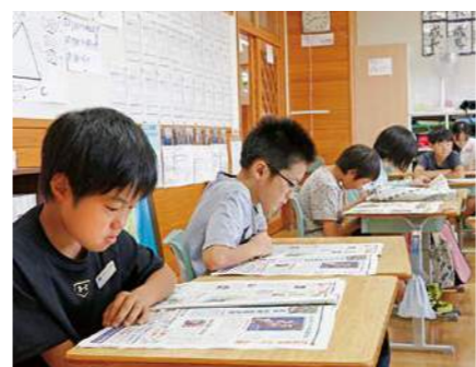
▲全校で新聞を読むNIEタイム(横手北小学校)

「教育関係者が視察に訪れていますが、どのようなことが注目されているのでしょうか」 さきほどの同一テーマでの研究という『学力向上推進事業』が注目されていますが、その中でもNIE(新聞を教材として活用すること。3ページ下段参照)や学校図書館の利活用です。横手市では、年8回『新聞の日』を設けています。この日は、横手市の児童生徒に新聞が配布され、