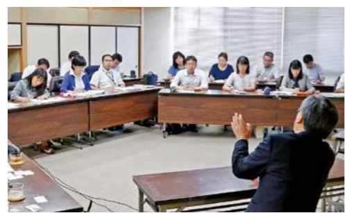
▲横手市を視察に訪れた県外の教育関係者らに講義する教育長

子どもたちに頑張ってもらいたいところを教えてください 今年の夏は部活動をはじめ、多方面での活躍が目立ち本当に嬉しかったです。学力も大切ですが、将来、社会の役に立ちたいというたくましい気