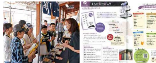
▲地域で頑張る大人へのインタビュー(十文字第一小6年) ▲横手を学ぶ郷土学総合テキスト『よこてだいすき』

横手を学ぶ郷土学総合テキスト『よこてだいすき』を発行し、各小・中学校へ配布。副教材として授業等で活用されている。