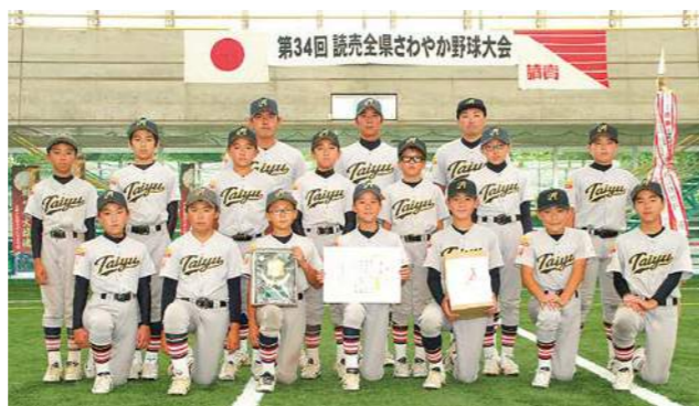
優勝 大雄野球スポーツ少年団