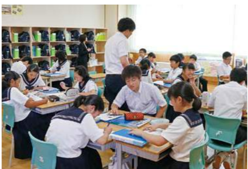
▲トリオによる授業風景(横手北中学校)

中学校の教職員が集まって公開研究会を開催し、テーマがどれほど達成されているかなどを協議しています。その成果を基に、次年度開催の学校が研究会を開催するわけですから、さらに深まった協議がされていきます。テーマが同じですから、先生方が別の学校に異動したとしても、それまでのキャリアをすぐに生かすことができるわけです。この市を挙げた同一歩調の体制が、横手市の教育の特色であり魅力だと思っています。