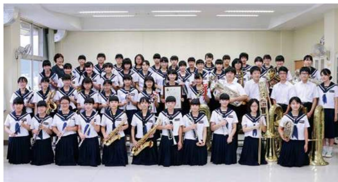
中学校の部 金賞 横手南中