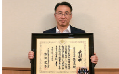
内閣府特命担当大臣(男女共同参画)表彰 社会福祉法人平鹿悠真会

時間単位で取得できる有給休暇や、子どもの行事などに利用できる多目的休暇を設けているほか、育児休暇を取得した職員が職場復帰しやすいように情報提供するなど、女性が仕事と家庭を両立できる職場環境づくりに取り組んでいることなどが評価されました。