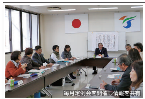
毎月定例会を開催し情報を共有

護者に避難を呼びかけることも役割の一つであり、誰もが安心して暮らせるように日々活動しています。いずれの委員も、民生委員法により、守秘義務がありますので、相談内容や個人情報が入るに漏れることはありません。困った時や悩みを抱えた時は、安心してご相談ください。地区担当の委員が分からない方は、市健康福祉部社会福祉課 ☎35・2132まで気軽に問い合わせください。