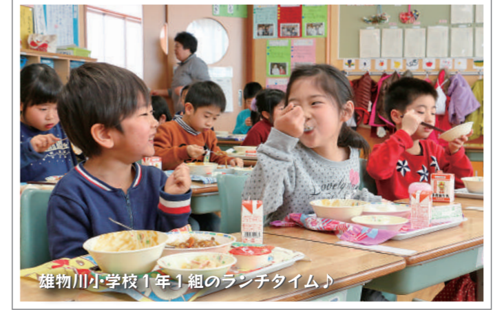
雄物川小学校1年1組のランチタイム♪