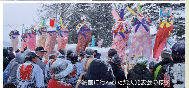
奉納前に行われた梵天発表会の様子

県内では新年最初の梵天行事といわれている『三助稲荷神社梵天奉納』が、1月3日、三助稲荷神社(大森地域川西地区)で開催されました。今年は各集落や大森小学校の児童、還暦を迎えた方で制作した梵天10本が奉納されました。「ジョヤサ、ジョヤサ」の掛け声に男衆らが拝殿めがけて駆け上がり、境内でもみ合いながら梵天とえびす俵を無事奉納。家内安全や五穀豊穡などを祈願しました。その後、餅やお菓子まきが行われ、新春から大いに盛り上がりました。