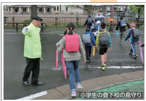
小学生の登下校の見守り