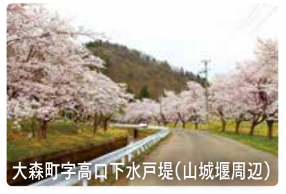
大森町字高口下水戸堤(山城堰周辺)