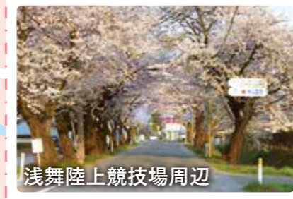
浅舞陸上競技場周辺