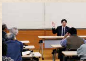
市政懇談会で市民と懇談する市長

また、市政懇談会を4月17日から5月12日まで開催しています。参加した市民の皆さんに市の考えをご理解いただくとともに、現在の市政についてさまざまなご意見やご提案を頂いていますので、今後の市政に活かしていきたいと思っています。