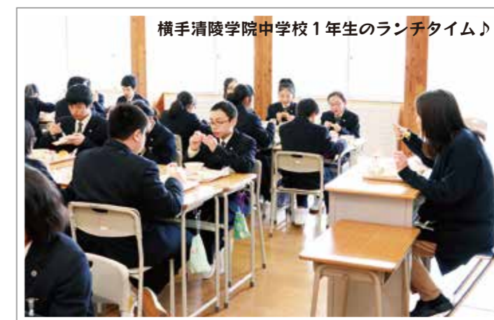
横手清陵学院中学校1年生のランチタイム♪