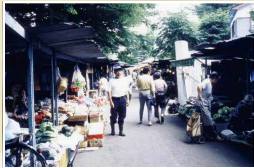
浅舞朝市 (平鹿地域) 昭和後期

上の写真は、昭和38年から平成4年まで浅舞のケヤキ(榎の木)周辺の琵琶沼通りで行われていた浅舞朝市の光景です。