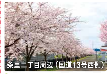
糸里二丁目周辺(国道13号西側)