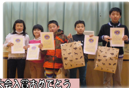
ケツすべり・紙ひこうき大会入賞おめでとう