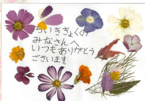
大雄小2年生の押し花作品