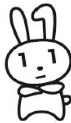
マイナンバーカード取得率

令和4年1月1日現在の全国の取得率（人口に対する交付枚数率）は41.0%で4割を超える方が取得しています。全国の年代別取得率は、20歳未満が30.8%、20歳～39歳が41.1%、40歳～59歳が41.6%、60歳～79歳が46.7%、80歳以上が41.1%となっており、20歳未満が若干低いものの、年代別の格差はそれほど大きくないようです。また、秋田県全体では38.2%、横手市は37.0%にとどまっています。取得率が全国で一番高い自治体は大分県姫島村で77.7%、特別区と市では宮崎県都城市が75.1%となっています。秋田県では藤里町が最も高く56.0%です。