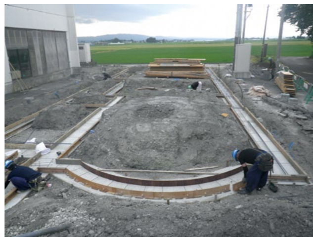
基礎型枠・鉄筋組立工事