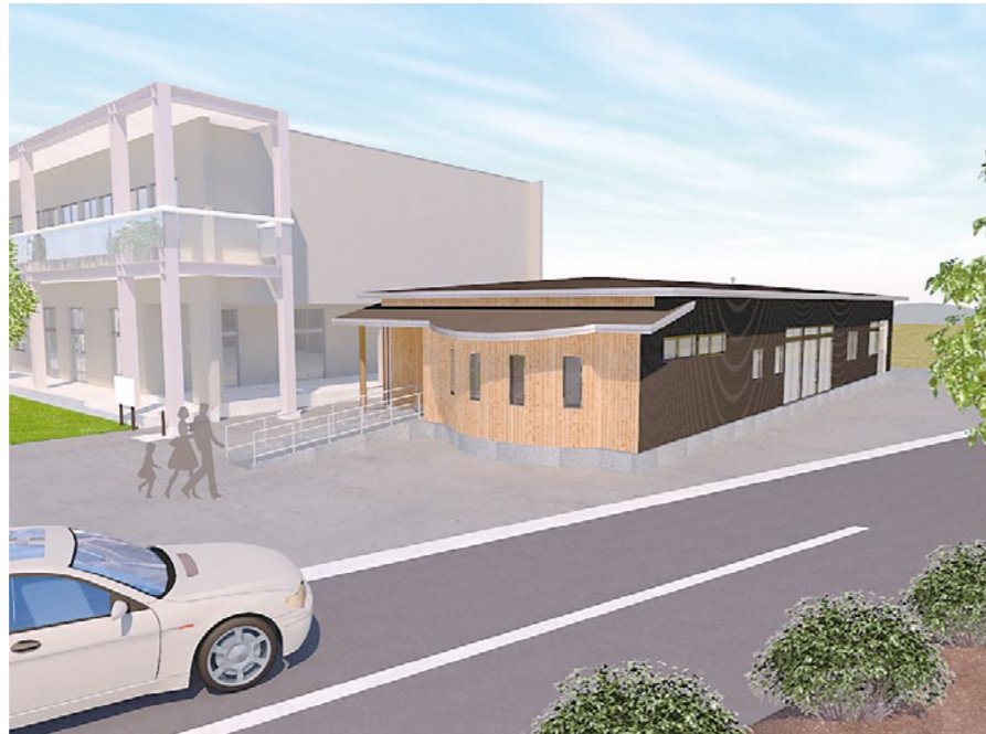
完成予定図 木造平屋建 延床面積 218.97㎡ 建築面積 226.43㎡ 展示室・和室・陶芸活動室

工事期間中は工事車両や騒音等で西地区館ご利用の皆様にはご迷惑をお掛けしますが、何卒ご理解ご協力をお願いいたします。