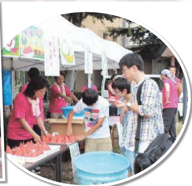
地元の味覚を試食