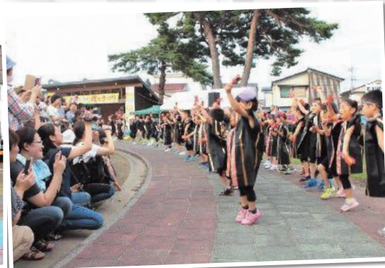
元気いっぱいのよさこい演舞