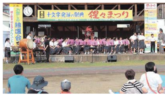
オープニングを飾った十中吹奏楽部