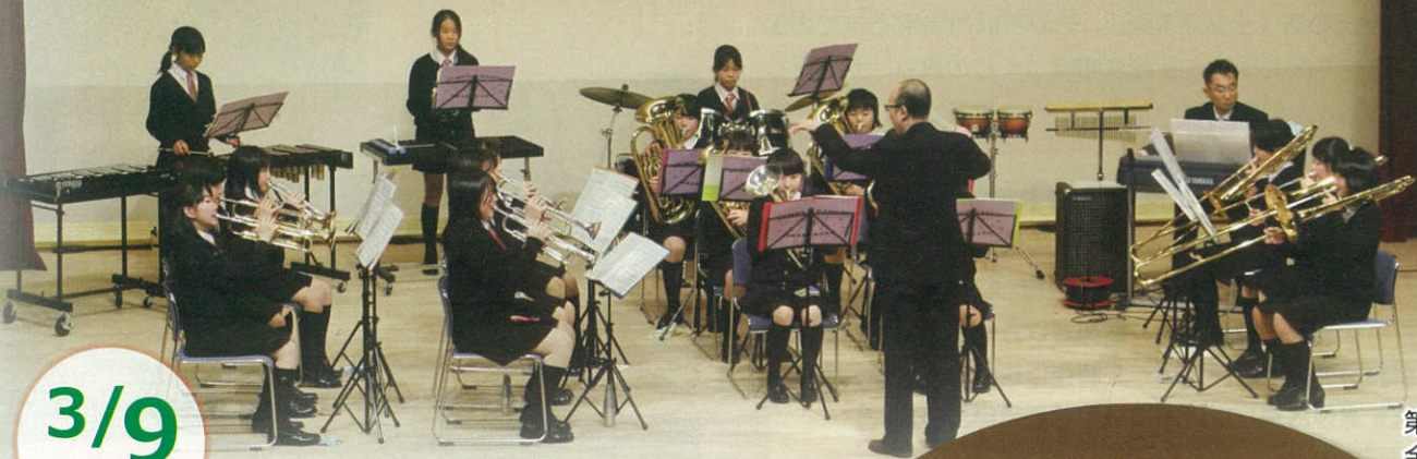
第一小 金管バンド部